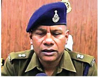
हरिभूमि न्यूज़ ►► अशोकनगर

शांत कहे जाने वाले अशोकनगर जिले में अब लॉरेंस विशनोई गैंग की एन्ट्री हो गई है। जब अलग अलग नम्बरों से इस तरह के मैसेज आए तो उसमें धमकी दी गई। यह मैसेज क्या लॉरेंस विशनोई गैंग से संबंध रखते हैं या फिर उस गैंग के नाम पर धमकाने का किसी और के द्वारा प्रयास किया गया है। जिसे जिले के पुलिस अधिकारियों द्वारा भी गंभीरता से लिया है। बताया गया है कि इस तरह के मैसेज के बाद अशोकनगर से लेकर भोपाल तक की पुलिस और इंटेलेजेंस ब्यूरो सक्रिय हो गया है।